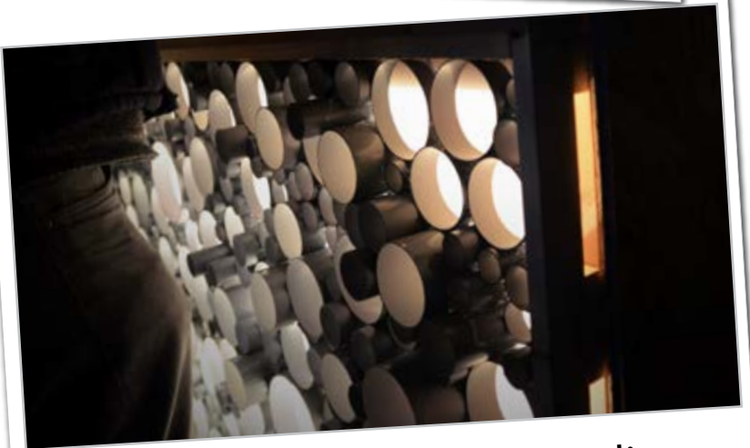
existenz - beste eetstandje